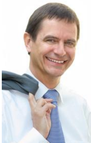
André Paul Bahuon, Président de l'Ordre des experts-comptables région Paris Ile-de-France

L'Ordre des experts-comptables région Paris Ile-de-France